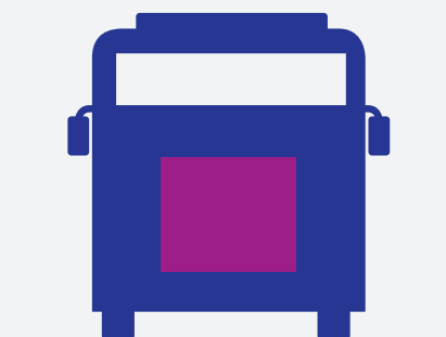
Arrière · 99 x 84 cm